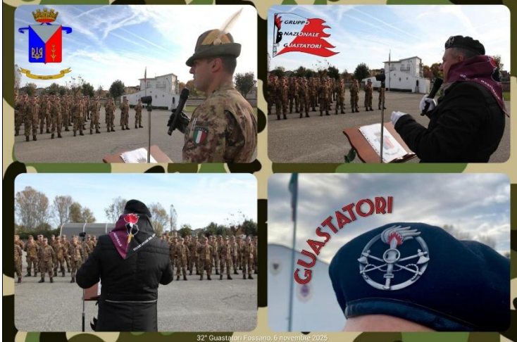
32° Guastatori Fossano, 6 novembre 2025

Per le Associazioni d'Arma, presenti il Medagliere dell'ANGET, Sezione Pietro Micca di Torino, e il Labaro del Gruppo Nazionale Guastatori Distaccamento Piemonte. "Il momento ha rappresentato un costante e continuo legame tra i guastatori e l'associazione nel solco dei valori e del continuo addestramento che hanno contraddistinto intere generazioni di Genieri".