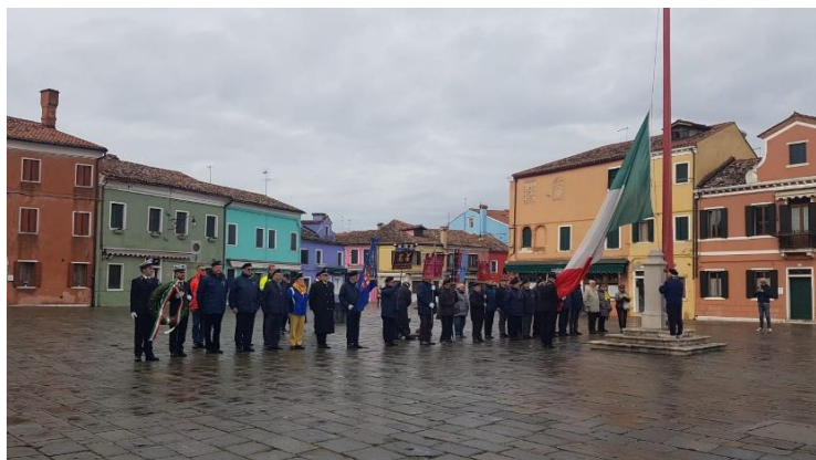
Santa Barbara a Burano